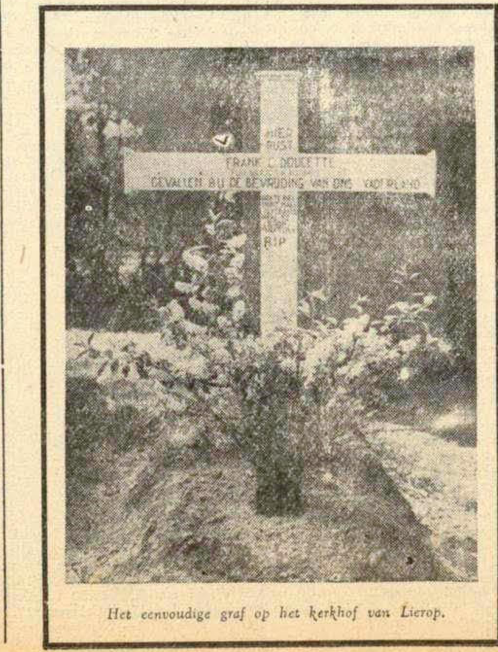
Het eenvoudige graf op het kerkhof van Lierop.

Alleen een vakman weet, of het gevaarlijk was, veel clandestien te bakken. Er was vaak voorraadcontrole in dien tijd, het moest allemaal kloppen. Hoe dan ook, een boschwachter Bussers erop uit, ook om z'n bijeengekochten rog te bakken te krijgen. Kon hij niet overal slagen. Maar bakker J. Hendriks te Lierop nam het risico voor witte prijzen. Hij bakte 3000 brooden in totaal, d.w.z. alle brood, dat door de kampbewoners op al de dagen van hun verblijf in Lierop gegeten werd. Is daar iets heldhaftigs aan? Men kan honderden dingen aanwijzen, die meer spectaculair waren in het verzet, waarbij het gedurfde avontuur z'n eigen aantrekkelijkheid uitoefende. Maar iederen dag clandestien bakken, altijd last en altijd opheldering der „fraude“ riskeer, lijkt dat is de onaantrekkelijke kant van het kleine werk in het verzet. Bakker Hendriks vroeg niet naar de winst of naar de bonnen. Hij hielp op Bussers' eerste verzoek en hij bleef dat doen tot het einde. Bakker Hendriks doet nu wat hij al de jaren deed: hij bakt het brood voor de Lieropsche menschen. Het bakken voor het kamp leverde hem de strop van f 75.— op, die hij aan den fiscus als omzetbelasting voor z'n clandestiene bakkerij betaalde.